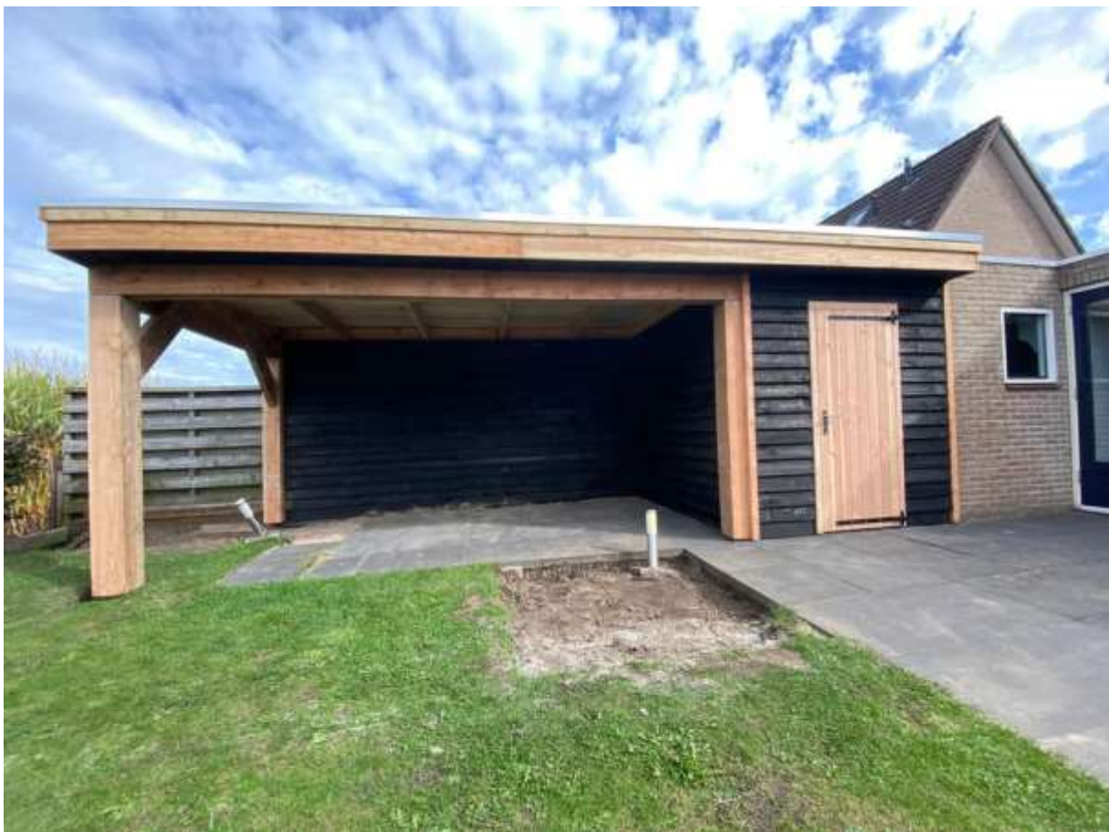
Veranda 3,5x7 meter, met aan 1 zijde een schuurtje. Een project als deze wordt op de dag zelf op locatie op maat gemaakt aansluitend op de bestaande bebouwing.