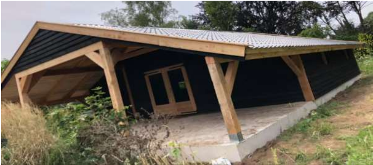
Apres ski hut 14x20 meter, voorzien van onze stalen dakpanplaten.