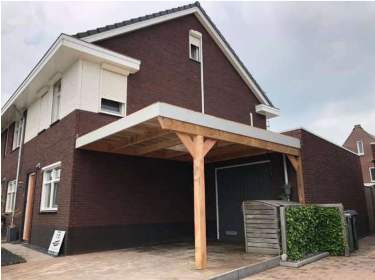
Carport 3x4,5 meter, voorzien van ayous voorgegronde dakrand.