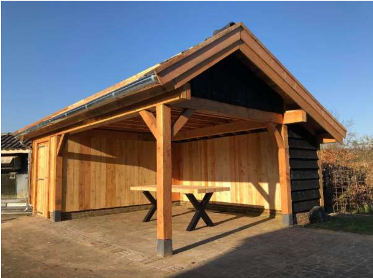
Kapschuur 6x8 meter. Deze constructie kan voorzien worden van stalen dakpanplaten of pannen naar wens.