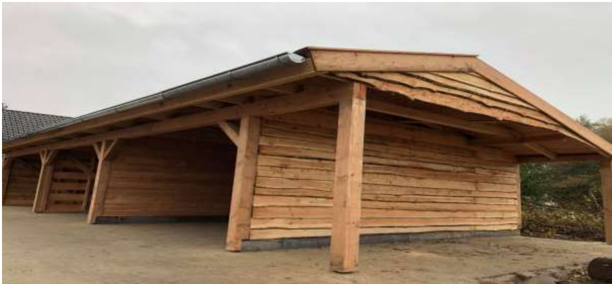
Paardenstal / carport. 6x18 meter.